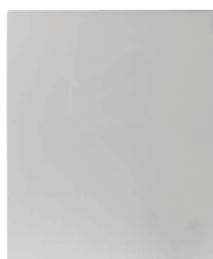
BS-SBA002GB Base da pavimento 400mm (A) x 380mm (L) x 270mm (P)