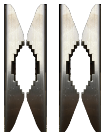
BS-SBA001PMA Kit fissaggio a palo