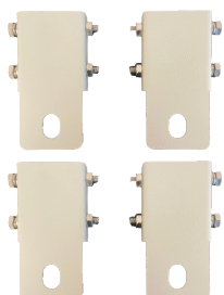
BS-SBA001WMA Kit fissaggio a muro