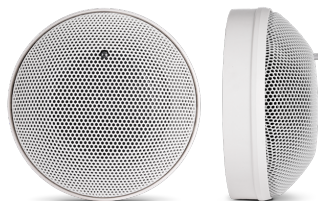
KSF5100001.003 - design mesh grigio KSF5100001.011 - design mesh bianco

Lo stato del rilevatore di fumo viene visualizzato in tempo reale nell'App lares 4.0 utente, nella pagina Sicurezza -> Sensori -> categoria Fumo.