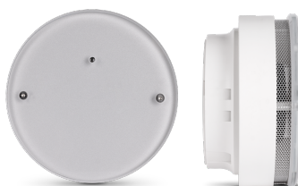
KSF5100001.001 - design vetro