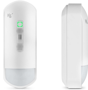
KSI5102011.300 unum-X DT/AM X5 - Grado 3

I rilevatori di movimento universali devono essere connessi alla centrale Ksenia lares 4.0 collegando le loro uscite di allarme e sabotaggio ad altrettanti ingressi in centrale o sui morsetti di un qualunque modulo di espansione.